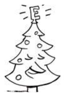
Illustration Marina Lutz